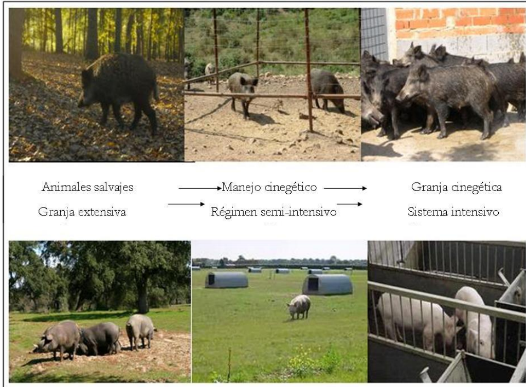
Figura 1.- Los cambios en el manejo de la fauna silvestre (hacia modelos más intensivos) y en la producción ganadera (hacia modelos más extensivos) complican la epidemiología y el control de las enfermedades compartidas.